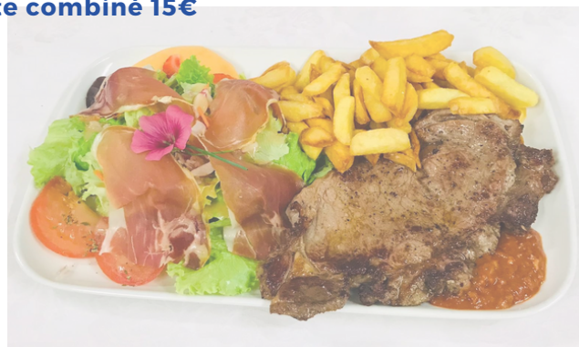
Assiette combiné 15€